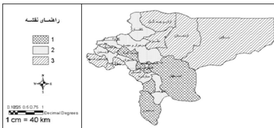
شکل ۲- جایگاه توسعه یافتگی شهرستان های استان اصفهان

نسبی است و برای محاسبه ضریب آن، از معادله زیر استفاده می شود (نادری و سیف نراقی، ۱۳۶۸: ۲۸).