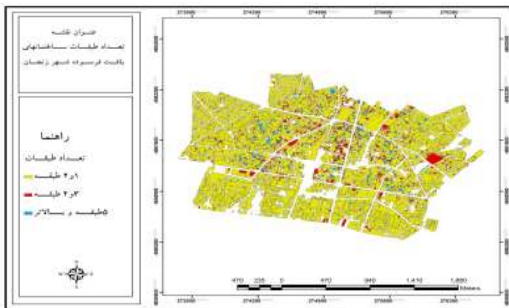
شکل ۳- نقشه تعداد طبقات ساختمان‌ها در بافت فرسوده شهر زنجان

با برآورده شدن پیش‌فرض‌های فوق، تحلیل رگرسیونی برای سنجش اندازه اثر متغیر مطلوبیت اجتماعی، از تحلیل رگرسیونی بر اساس روش حداقل مربعات استفاده شده است. نتایج به دست آمده از انجام دادن تحلیل رگرسیونی نشان می‌دهد، متغیر مستقل مطلوبیت اجتماعی که وارد معادله شده، توانسته ۳۳ درصد تغییرات متغیر وابسته را تبیین نماید.