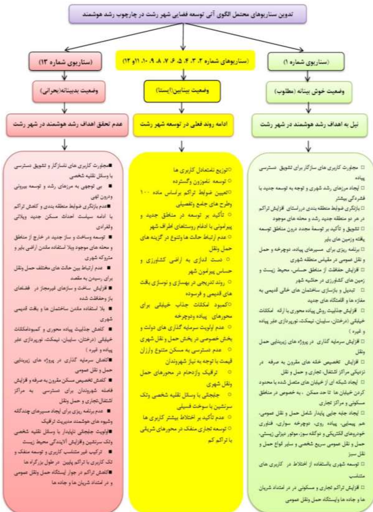
شکل ۲. گروه بندی سناریوهای تدوین شده در چارچوب الگوی رشد هوشمند