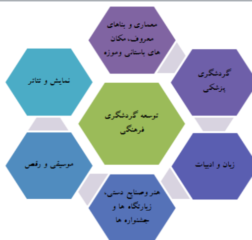
شکل ۱. پیوندهای توسعه گردشگری فرهنگی منبع: (Zadel & Bogdan, 2013: 53).

گردشگری فرهنگی به عنوان شکلی انتخابی از گردشگری، در ابتدا پاسخی به گردشگری انبوه بود. در حال حاضر، گردشگری فرهنگی منطقه بسیار وسیعی را پوشش می‌دهد (Zadel & Bogdan, 2013: 53). سازمان جهانی گردشگری سازمان ملل متحد در سال ۱۹۸۵ گردشگری فرهنگی را به این صورت تعریف کرد: "... سفر با انگیزه فرهنگی، مانند مطالعه، تئاتر، و تورهای فرهنگی، سفر به جشنواره‌ها و رویدادهای فرهنگی، بازدید بناها و مکان‌های تاریخی، سفر به منظور کشف طبیعت، فرهنگ عامه و یا هنر و زیارت" (Tomljenovic, 2006: 123). علاوه بر این، تحقیقی که توسط سازمان جهانی گردشگری انجام شد نشان داد که گردشگری فرهنگی تا ۴۰٪ سفرهای گردشگری جهان را پوشش می‌دهد (Paulina و Meleddu, Brida, 2013: 112)، گردشگری فرهنگی یک مفهوم مرکب است. گردشگری فرهنگی یک ایده آل چند جانبه است. در واقع تعریف گردشگری فرهنگی یک کار پیچیده است زیرا تعاریف مختلفی در مورد گردشگری فرهنگی وجود دارد زیرا انگیزه‌ها و علایق گردشگران فرهنگی متفاوت است. بخش اداره‌کننده سایت‌ها و میراث‌های فرهنگی محافظت شده آمریکایی (ICOMOS) که شورای بین‌المللی ابنیه و محوطه‌ها سازمانی برای نگهداری و پاسداری از اماکن میراث فرهنگی در سراسر جهان است، مشاهده کرد که "گردشگری فرهنگی به صورت یک نام به معنی بسیاری از چیزها برای بسیاری از مردم با نقاط قوت و ضعف گردشگری است" (USICOMOS, 1996: 102).