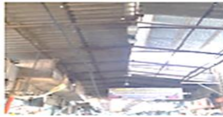
تصویر شماره ۱۴- سقف با پوشش موقت - بازار شوشتر.

- ابعاد معنایی: معنا یعنی اینکه شهر تا چه اندازه می‌تواند به وضوح درک شود، از نظر ذهنی قابل شناسایی باشد، ساکنان آن را در زمان و مکان به تجسم درآورند و تا چه اندازه آن ساختار ذهنی با ارزش‌ها و مفاهیم جامعه در ارتباط است (Behzad Far, 2007: 37). تمامی محیط‌های شهری دارای معنی هستند. در یک محیط معمولی بیشتر اشیاء و پدیده‌هایی که درک می‌شوند دارای معنی‌اند. در آن‌ها امکانات مختلفی برای فعالیت وجود دارد و اشاراتی که در آن‌ها اتفاق افتاده یا ممکن است اتفاق بیفتد، نهفته است (Pakzad, 2008: 99). اما فضای شهری موفق فضایی است که دارای بار معنایی غنی باشد. در بازارهای دزفول و شوشتر درگیر شدن حواس شنیداری در بازار مسگرها و حس بویایی در گذر از راسته عطاری‌ها تأثیر زیادی بر انسان می‌گذارد. این غنای حسی موجب میشود ادراک عمیق‌تری از محیط صورت پذیرد.