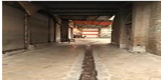
تصویر شماره ۴- راسته سرپوشیده- بازار دزفول.

فضای شهری از اجزا و عناصر گوناگون تشکیل شده است. آنچه باعث درک فضا به صورت یک کل منسجم در ذهن مخاطب می‌گردد، سیستم نظم‌دهنده است. به وسیله این سیستم نظم دهنده مشترک، ارتباط فضایی میان تک تک اجزا با یکدیگر و با پیرامونشان برقرار می‌شود. همان‌طور که گروتز می‌گوید همیشه حداقلی از همبستگی میان اجزا یعنی حد معینی از وحدت ضروری است. اگر چنین نباشد آنچه به وجود می‌آید دیگر کل نیست بلکه تنها آشفتگی است (Grotter, 1995: 551). وجود فضاهای باز مانند می‌دانچه‌ها، فضاهای نیمه باز مانند ساباط‌ها و فضاهای بسته مانند راسته‌های سرپوشیده منجر به ایجاد یک انتظام فضایی شده و می‌توان این نظم را در بازار شوشتر و به خصوص در بازار دزفول مشاهده نمود.