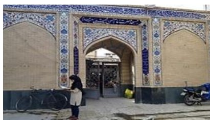
تصویر شماره ۱۳- مسجد واقع در بازار دزفول.

تباین در لغت به معنای تفاوت و فرق میان دو چیز است. تباین در ارتباط یک پدیده با زمینه‌اش یا یک پدیده با پدیده‌های مجاورش آشکار می‌شود. تباین باعث می‌شود که هر پدیده‌ای از پدیده‌های کناریش تفکیک شود و برای ایجاد یک محیط شهری جالب و سرزنده لازم و ضروری است. تباین یکی از اصول پرکاربرد در طراحی شهری ایرانی است (Arbabzadeh Hashemi & Ranjbar, 2009: 51). پهن و باریک شدن عرض فضا از نموده‌های عینی تباین در فضای بازارها محسوب می‌شود. از طرفی تباین در عملکردها مانند همجواری بازار دزفول و شوشتر با عناصر مذهبی مانند حسینیه‌ها و مساجد به خوبی ویژگی سرزنده بودن و لذت بردن از حضور در محیط و عدم کسالت و یکنواختی فضا را به بیننده القا می‌نماید. در واقع تباین و ناهمگونی می‌تواند برای بیننده جالب باشد و تجربه لذت از حضور در محیط را در ذهن بیننده تداعی سازد.