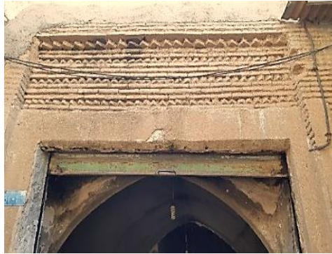
تصویر شماره ۹- استفاده از آجر و کاهگل در نمای بیرونی حجره - بازار دزفول.

استفاده از آجر و بعضاً کاهگل به عنوان نمود معماری ایرانی در تمام نماها در سطح دو بازار قابل مشاهده است. در واقع استفاده از عناصر بومی در نمای حجره‌ها ضمن کمک به هماهنگی الگوی نماها، ویژگی‌های جغرافیایی و بومی برگرفته از محیط و معماری ایرانی را برای بیننده تداعی می‌کند.