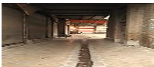
تصویر شماره ۶- سادگی در شکل- بازار شوشتر.

سادگی شکل در کل و جز و استفاده از اصول معماری مشترک، باعث به وجود آمدن هماهنگی شکلی جداره‌ها و در نتیجه منجر به پیوستگی فضاهای شهری- سنتی ایرانی شده است. بازارهای دزفول و شوشتر نیز از این اصل مبرا نیست به طوری که هماهنگی در شکل در کل طول این دو بازار مشخص است.