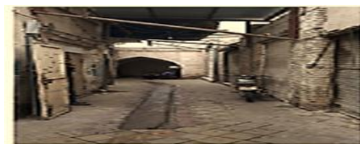
تصویر شماره ۸- پیوستگی در رنگ و بافت بازار دزفول.

پیوستگی در واقع یکی از ارکان هویت به شمار می‌رود (Goodarzi Soroush & Goodarzi Soroush, 2013:103). یکی از عوامل پیوستگی این فضاها غالب بودن رنگ خاک (رنگ کاهگل) است که در سرتاسر هر دو بازار به وضوح دیده می‌شود. کاربرد رنگ برگرفته از طبیعت بومی منطقه، حس پیوستگی انسان با محیط را غنا می‌بخشد. استفاده از رنگ‌های روشن در هر دو بازار منجر به تلطیف فضا به سمت القا آرامش به انسان حاضر در محیط می‌شود.