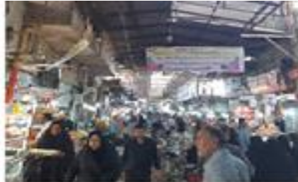
تصویر شماره ۲۱- تعامل گروه‌های اجتماعی مختلف در بستر بازار - بازار شوشتر.

بازار بستر تعامل گروه‌های اجتماعی مختلف با سن، جنسیت، بینش و ایدئولوژی و تجربه‌های متفاوت است. فضای بازار بستری است برای سلیقه‌های متفاوت، ترویج یا نفی فرهنگ مصرف‌گرایی، تظاهر جلوه‌هایی مانند پوشش و ابراز دیدگاه‌های فرهنگی، مذهبی، و بعضاً سیاسی و... که در کل بخشی از فرهنگ و هویت را در قالب تعاملات اجتماعی شکل می‌دهد.