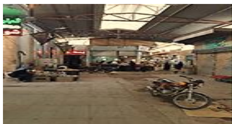
تصویر شماره ۷- سادگی در شکل- بازار دزفول.