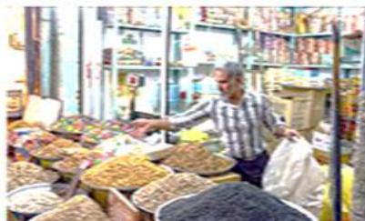
تصویر شماره ۱۷- راسته خواربار فروش‌ها - بازار دزفول .

حیات مستمر اقتصادی در بازارهای سنتی دزفول و شوشتر در سالیان متمادی موجب شده بازار به صورت فضایی محسوس و ملموس وارد زندگی روزمره شهروندان شود. به طوری که شهروندان آن را جزئی از زندگی خود می‌دانند. از طرف دیگر، پیشینه‌ی تاریخی در این فضاها نهفته است که برای بسیاری ارزشمند است و ارزش‌ها و مفاهیم گذشتگان را در خود جای داده است.