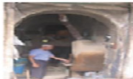
تصویر شماره ۱۰- حجره با قوس ایرانی، رومی - بازار دزفول. منبع: یافته‌های تحقیق، ۱۴۰۰