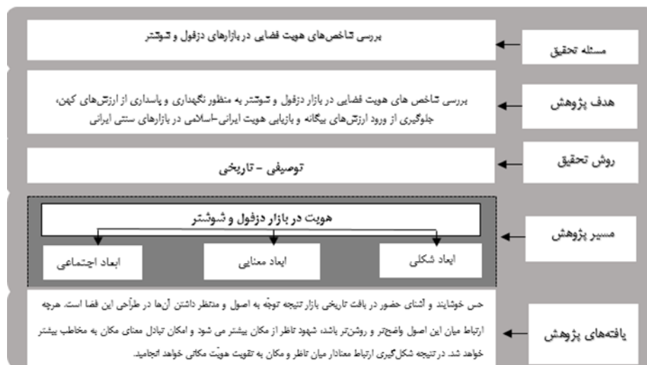
شکل شماره ۱- سازه پژوه