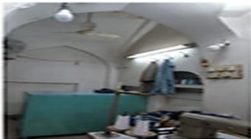
تصویر شماره ۱۱- حجره با قوس اسلامی - بازار دزفول.

تضاد به این معنی است که آنچه ساخته می‌شود به عمد خود را از محیط اطراف جدا کرده به عنوان چیز دیگر خود را نشان می‌دهد. در دیدگاه نظریه اطلاعات، چیز دیگر بودن به معنی غیر منتظره بودن است یا بداعت. هر چیز بدیعی باید حداقل ارتباطی با چیزهای قبلی (زمینه) داشته باشد تا پیام آن قابل درک باشد (Arbabzadeh Hashemi & Ranjbar, 2009: 50). وجود تضاد در اجزای کالبدی تشکیل‌دهنده فضای بازار مانند تضاد در کف از طریق اختلاف در سطح حجره‌ها با یکدیگر در بازار دزفول و شوشتر دیده می‌شود. تضاد در بدنه در قالب وجود طاق‌های متفاوت که منجر به ایجاد فرم‌های مختلف در بازار دزفول شده از جلوه‌های تضاد در بازار است. استفاده از سقف‌های موقت با جنس‌های متفاوت فلزی، چوبی و بعضاً حصیری، به خوبی وجود تضاد و ناهمگونی را در هر دو برای بیننده تداعی می‌بخشد. تضاد فضایی که ضمن احساس لذت، و سرزنده بودن منجر به جذابیت محیط برای انسان حاضر در محیط می‌شود که این مسأله خود ذهن بیننده را با محیط و ویژگی‌های خاص فرهنگی، تاریخی، اجتماعی و... و آنچه که اصطلاحاً شخصیت و هویت محیط است مرتبط می‌سازد.