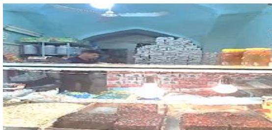
تصویر شماره ۱۲- حجره با قوس اسلامی- بازار شوشتر.