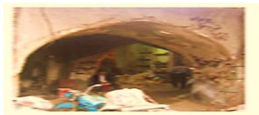
تصویر شماره ۵- ساباط- بازار دزفول.