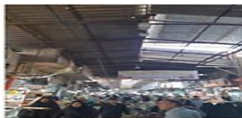
تصویر شماره ۲- راسته اصلی- بازار شوشتر. منبع: یافته‌های تحقیق، ۱۴۰۰ تصویر شماره ۳- فضای بین دو راسته - بازار شوشتر. منبع: یافته‌های تحقیق