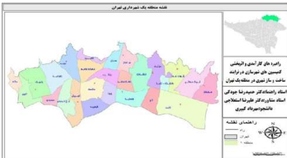
شکل ۱ - نقشه محدوده منطقه ۱ شهر تهران