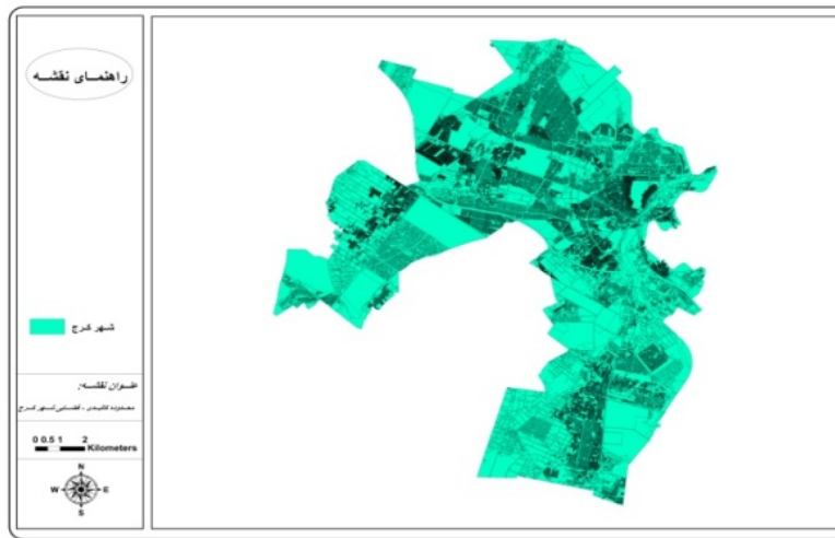
شکل ۱- نقشه کالبدی- فضایی شهر کرج

فریاد اخذ شده باشد در این صورت نیز با سابقه باستانی آن ارتباط پیدا می‌کند زیرا در تپه آتشگاه و کوه‌های مراد تپه و کلاک و قلعه دختر شهر ستانک در ایام باستان برای خبر رسانیدن و دیده‌بانی آتش‌افروزی می‌شد و به این طریق هجوم دشمن را به یکدیگر خبر می‌دادند. احتمالاً کرج مبدأ خبری بزرگی جهت رگا