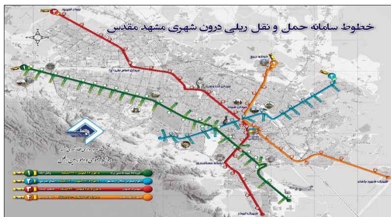
شکل ۱- نقشه خطوط قطار شهری مشهد در برنامه بلند مدت- منبع: شرکت بهره برداری قطار شهری مشهد، ۱۳۹۶.