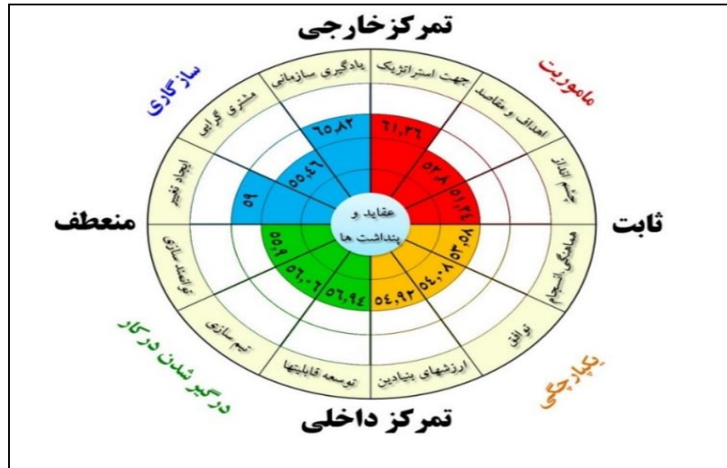
شکل ۱ - تصویر کلی فرهنگ سازمانی در خط یک قطار شهری مشهد

خارجی سازمان را دارای قوای بیشتری نشان می‌دهد و بیان‌گر ارتباطات متقابل بیرونی آن است؛ چرا که ارتباطات بیشتری با شهروندان و سایر سازمان‌ها و نهادهای درگیر در فرآیند خدمت رسانی قطار شهری مشهد وجود دارد. در محور عمودی مدل نیز، سازمان دارای قابلیت بیشتری برای انعطاف و ایجاد تغییرات بر اساس نیازهای متغیر و نه فقط پیروی از دستورالعمل‌های ثابت است.