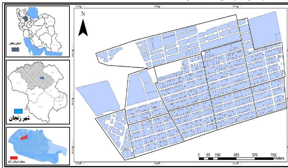
شکل ۱- موقعیت محله اسلام آباد در شهر زنجان و کشور- ترسیم: نگارندگان، ۱۳۹۷.

از جمعیت شهر را در خود جای داده است. محله اسلام آباد امروزه با ساخت و سازهای صورت گرفته شده در شمال آن مانند شکل گیری کوی فرهنگ (علی آباد) و الهیه و شهرک جدید صدرا کاملاً در داخل شهر قرار گرفته است و از نظر کالبدی در حاشیه شهر قرار ندارد ولی همواره با چشم اندازی پر تراکم و بافتی پر و شلوغ به چشم می زند (Daviran et al, 2011: 120).