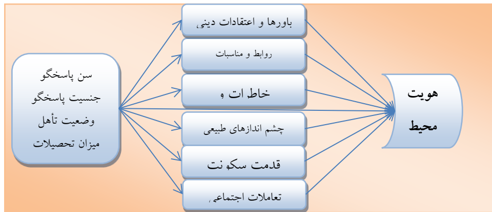
نمودار ۱ مدل تحلیل نظری هویت محیطی

خودش را نشان می‌دهد و دوم این که هر هویت مرزی دارد که آن را بیرون از خودش و از غیر خودش جدا می‌کند. به عقیده او هویت محیطی به دو راه مطرح می‌شود: ۱- هویت اثباتی که تعلق فرد را به گروه و مجموعه نشان می‌دهد و در بر دارنده همبستگی داخلی است. ۲- هویت القایی که به وسیله عناصر و عوامل محیطی گروه و جامعه‌ای خاص، در مقابل افراد و گروه‌های بیگانه متمایز می‌شود (۲۵). براساس این دیدگاه هویت محیطی شهروندان بر اساس انسجام و همبستگی بین فرهنگی شهروندان و در رابطه دیالکتیکی بین شهروندان با محیط‌زیست آن‌ها و از طرفی دیگر در تعریف و تثبیت مرزهای جغرافیایی و فرهنگی شهروندان با دیگران شکل می‌گیرد. بوردن ۱ بر این باور است که یکی از انگیزش‌های مرتبط با هویت، میل به پیوندجویی یا تعلق است. این تعلق به محیط خود را در پیوند دادن با محیط زندگی، مشاهده حیات اجتماعی، احساس یکی شدن با طبیعت و میل به احساس تعلق به محیط نشان می‌دهد. به باور بوردن افراد با احساس بالای مکان یا محیط؛ رفتارهای مغایر اجتماعی کم‌تری را در محدوده و قلمرو خود نشان می‌دهند و بنابراین، در طراحی محیط‌های شهری باید به حس مکان یا هویت افراد توجه کرد. دل‌بستگی مکانی این واقعیت را بیان می‌کند که افرادی که دل‌بستگی کمی به مکانی که در آن زندگی می‌کنند، دارند،