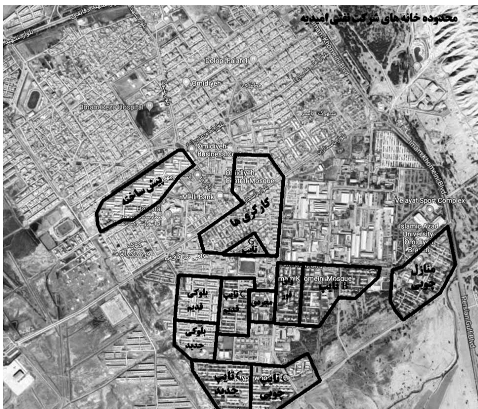
شکل ۱- محدوده منازل شرکت نفت شهرستان امیدیه

را به تدریج جایگزین الگوی آبادی ها و شهرهای «خودرو» کردند (قاسمی، ۱۳۹۵، ب). به غیر از مسجد سلیمان به عنوان شهر اول نفت و آبادان شهر دوم نفت، به تدریج شهرها و مکانهای دیگری نیز در روند شهرسازی و رشد و توسعه صنعتی ناشی از اکتشاف نفت در جنوب ایران جلوه گر می شوند، که همپای با ادامه تحولات در قطب قبلی نفت در جنوب، شروع به تحول و توسعه می یابند. (مهندسان مشاور پژوهش و عمران، ۱۳۶۵، ۲۴). شهر امیدیه بعد از اکتشاف نفت و گاز شکل گرفت و ابتداء به (سی برنج) معروف بوده