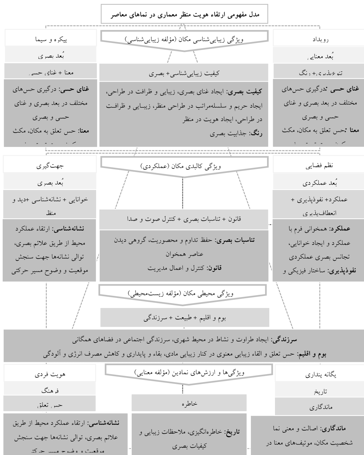
شکل ۳- مدل مفهومی ارتقاء هویت منظر معماری در نماهای معاصر (Authors Studies, 2020)